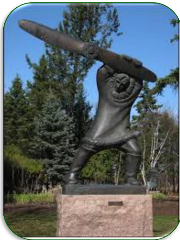
Том Лемб. Скульптура. 1991. Бронза Вінніпег, Канада.