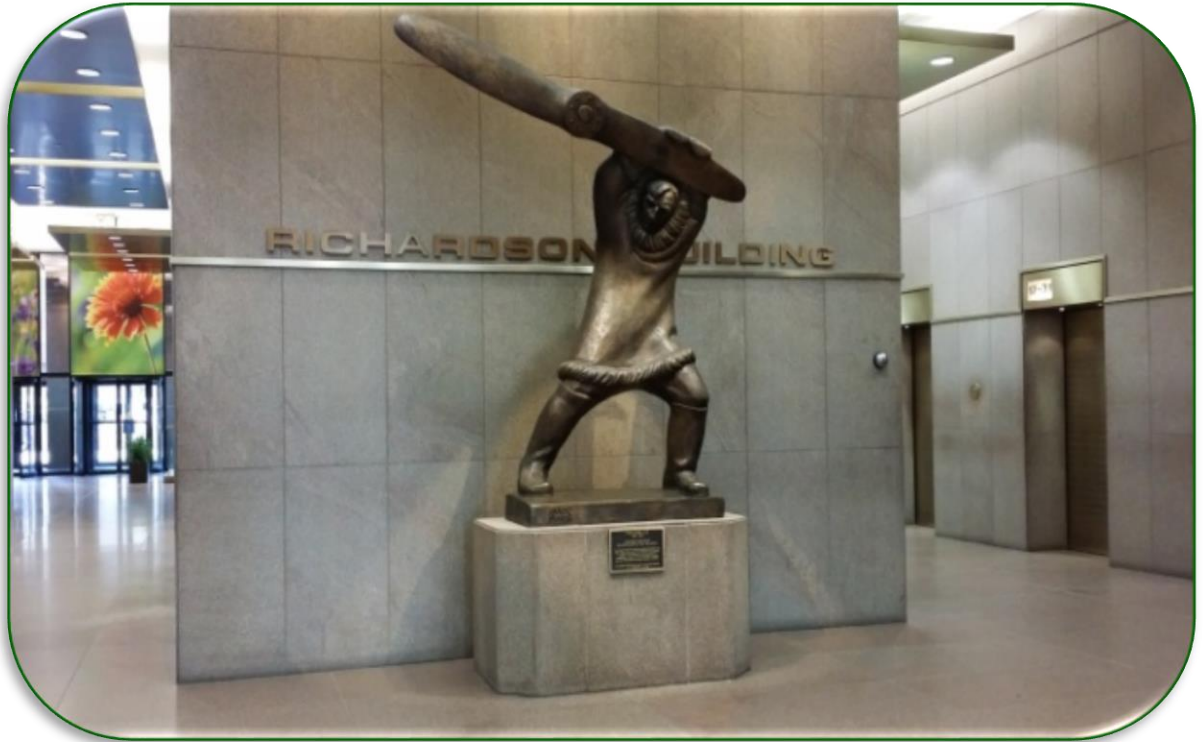
Статуя авіатора у фойє Річардсон-білдінг