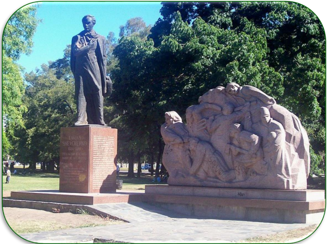
Пам'ятник Т.Шевченку в Буенос-Айресі