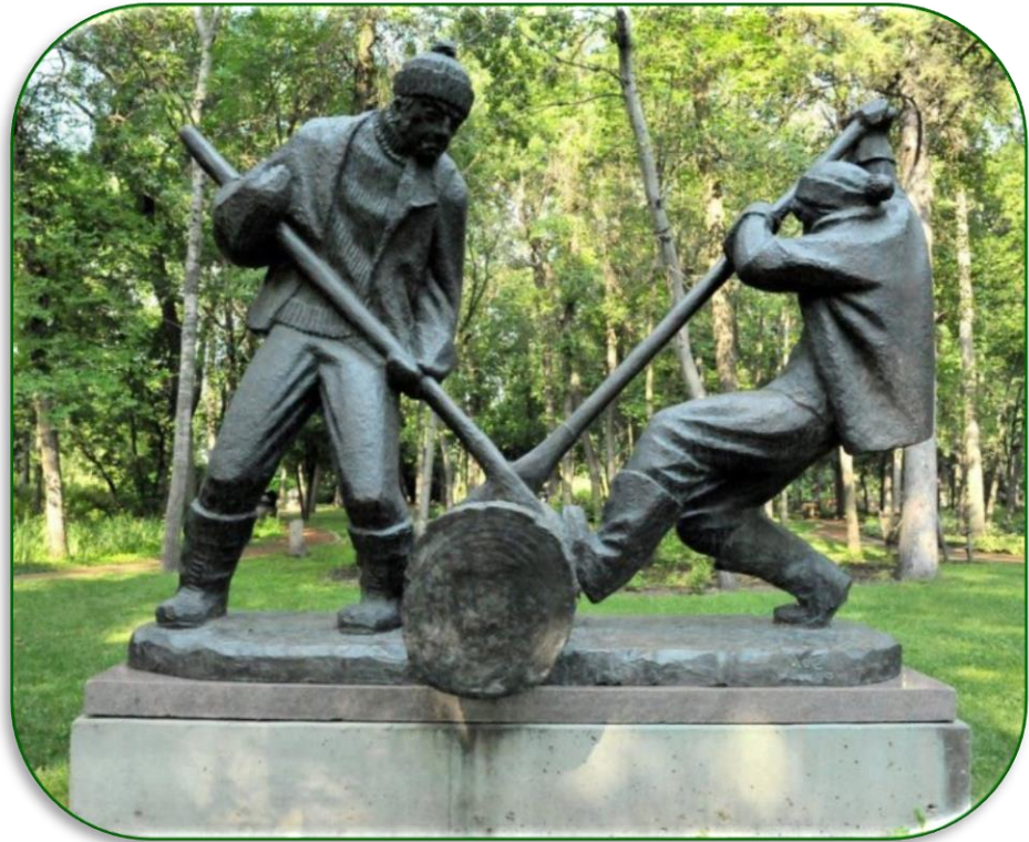
Лісоруби. Парк скульптур Лео Мола