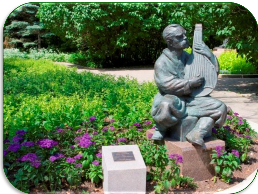
Лео Мол. Blind Bandurist (Сліпий бандурист). Скульптура. 1996 Сад Лео Мола. Вінніпег, Канада